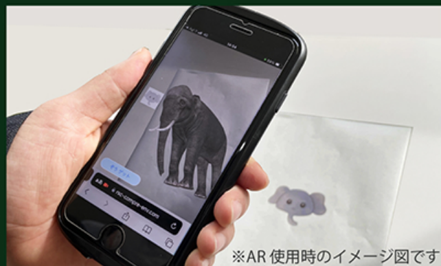
※AR使用時のイメージ図です

実在する風景にバーチャルの視覚情報などを重ねて表示することで、目の前にある世界を仮想的に拡張するというもので、現実世界とデジタルの世界を掛け合わせたような物になるのが特徴です。さまざまなゲームに使用されている技術です。