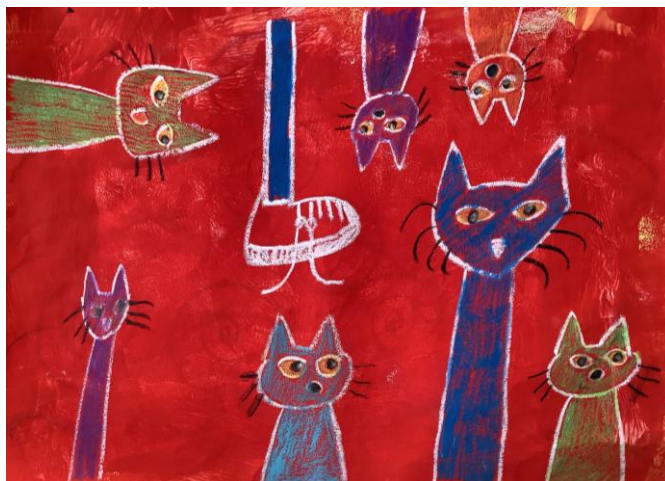
読書感想画 生徒作品