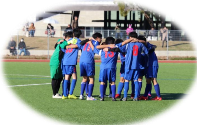
サッカー部活動の様子

本リーフレットの教育支援事業の概要についてご理解いただき、ご活用していただきますようお願いいたします。