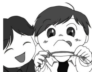
↑ハーネスの組付け