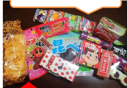
駄菓子も立派な非常食！