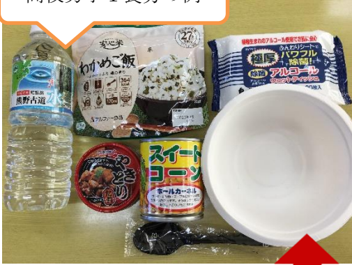
高校男子1食分の例

1学期に防災訓練の一環として、防災食をお昼ご飯として食べる時間がありましたね。一例として1食分の食料とバッグの中身を紹介します。参考にしてください。