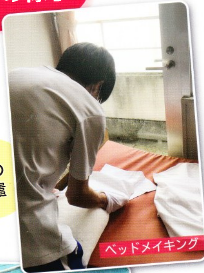
ベッドメイキング