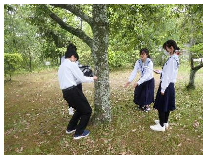
図6 樹木の胸高直径の測定

生物分野では、上野城公園を調査地として上野城公園内に生育する樹木の炭素蓄積量から、どれくらいの炭素が森林にストックされているのか求めた。樹木が蓄える炭素量は、調査する樹木の胸高直径(DBH)と樹高(H)から以下の推定式を用いて幹重( W_S )、枝重( W_B )、葉重( W_L )を算出し、地上部重( W_T )をそれらの和として算出することができる(図6)。