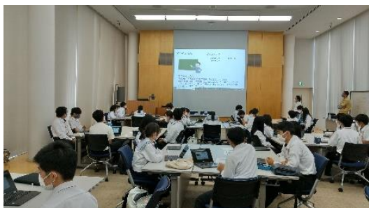
図3 ローム株式会社でのグループ学習

半導体企業である「ローム株式会社」を訪問し、半導体をどのような場面で活用していくことができるかグループに分かれ、議論、発表を行った(図3)。