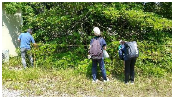
図13 三重大学構内でのタブノキ種子採集

個人研究となったことで、意欲的に取り組む生徒が増え、大学や専門機関との連携も増加した。現在、三重大学、三重大学伊賀研究拠点、鳥羽水族館等に試料の提供、実験・調査方法、解析方法について助言をいただいている。具体例として「タブノキの種子の発芽特性」について研究している生徒は、三重大学内に生育するタブノキを案内してもらい種子の採集を行った(図13)。種子の発芽条件の温度設定、サンプル数等の実験条件や先行事例に関してアドバイスをいただいた。また「伊賀市におけるセイヨウタンポポとカンサイタンポポの割合」について研究している生徒は、セイヨウタンポポとカンサイタンポポ、雑種タンポポのDNA解析の手法について御指導いただいた(図14)。