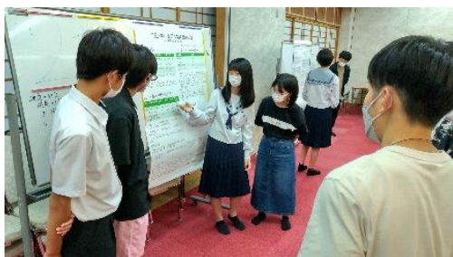
図4 1年生によるポスター発表

また、理数科合宿中に1年生は2年生へむけて7月に取組んだ三重大学伊賀研究拠点実験実習の内容についてポスター発表を行う。1年生から2年生と理数科の卒業生に向けて発表を行うことで交流を図るとともに2年生の評価者としての力も育成する(図4)。