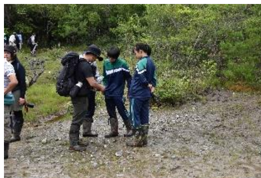
図17 希少植物の観察