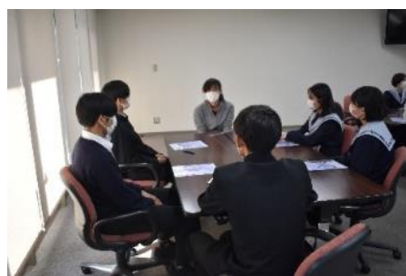
図15 京都大学エネルギー理工学研究所