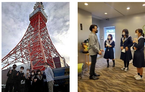
図12 卒業生が勤務する企業への訪問

東京キャリアアップツアーは、自己の将来のキャリアを考えることを目的として、東京で勤務する上野高校の卒業生の企業を班に分かれて訪問する。昨年度は、ライフネット生命、i-Plug、TIS株式会社、日立製作所、三菱総合研究所、旭化成、サイオステクノロジー、ネット・プロダクションズを訪問した。企業訪問だけでなく、卒業生から高校時代に学校生活をどのように過ごしたか、どのようにして大学を選んだのかなど様々な進路実現に関わる話をしていたらいている。(図12)。