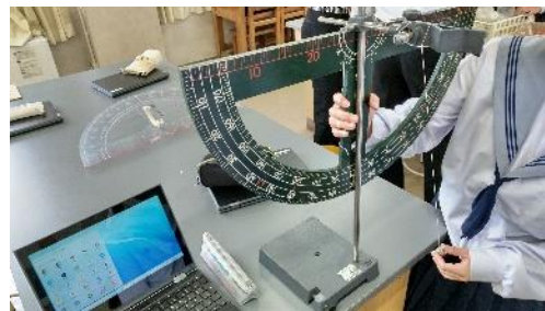
図8 振り子の周期の測定

物理分野では、例年、1本の針金を用いてコマの作成を行っていた。どのような構造にすれば長く回るコマが作製できるか試行錯誤しながら作製した。今年度は内容を変更して「振り子の周期を正確に計測する」というテーマで行った。変更理由としては、数値を扱い、統計処理に取り組むこと、授業で学習する内容と結びつけるためである。今回の内容は、物理チャレンジ2023の課題実験を簡易化したものである。はじめに、基礎実験を行い振り子の周期を理解した後、どのような工夫をすれば振り子の周期を正確に計測できるかを班毎に考察した。各班で糸の長さや重さ、測定位置、角度など試行錯誤する姿がみられた(図8)。そして最後に工夫した内容と測定値を班毎に発表した。