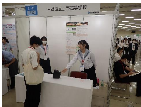
図16 令和5年度SSH 生徒研究発表会