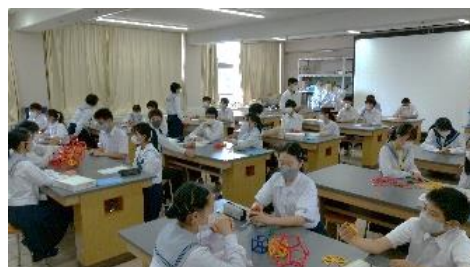
図5 理数科体験講座(理科・数学)