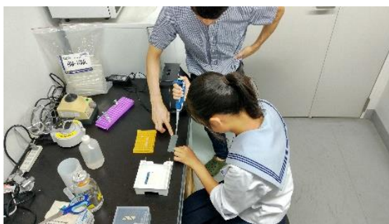
図14 PCRと電気泳動の実験

「古代魚の鱗の強度の比較」について研究している生徒は様々な施設に主体的に問い合わせ、鳥羽水族館から飼育下で死亡したアリゲーター1個体を譲っていただいた。