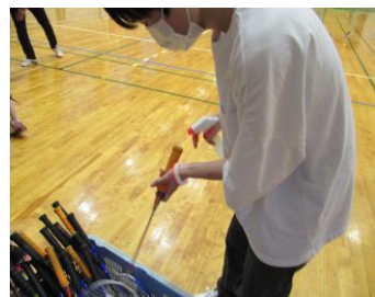
準備や運営にも協力しました (道具の消毒風景)