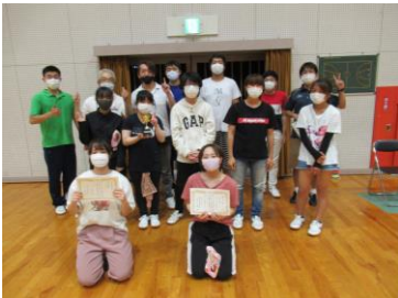
総合優勝のCチームの皆さん