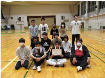
総合優勝のDチームの皆さん