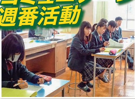
聞き取った内容を、クラスで伝達