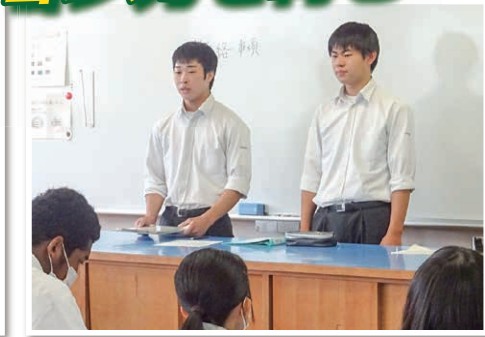
連絡事項を伝え 1分間スピーチ