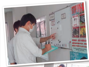
◀ 時間割変更をメモ