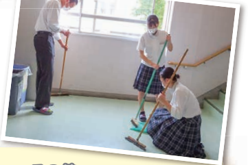
▶ 週番としての 朝の清掃