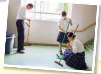
週番としての 朝の清掃