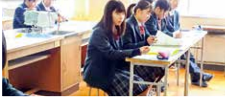
聞き取った内容を、クラスで伝達