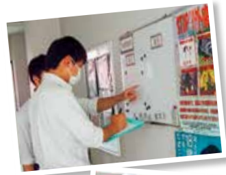
時間割変更をメモ