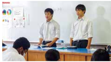
連絡事項を伝え1分間スピーチ