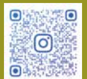
英語コミュニケーション科 Instagram