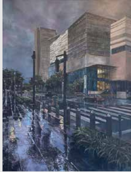
美術コース油彩画専攻