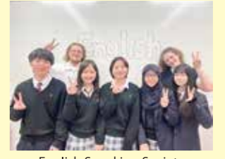
English Speaking Society