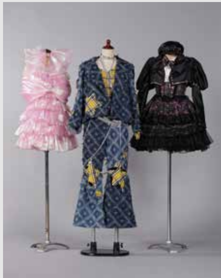
服飾デザインコース