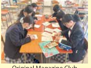
Original Magazine Club