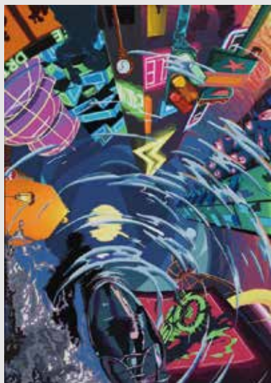
ビジュアルデザインコース