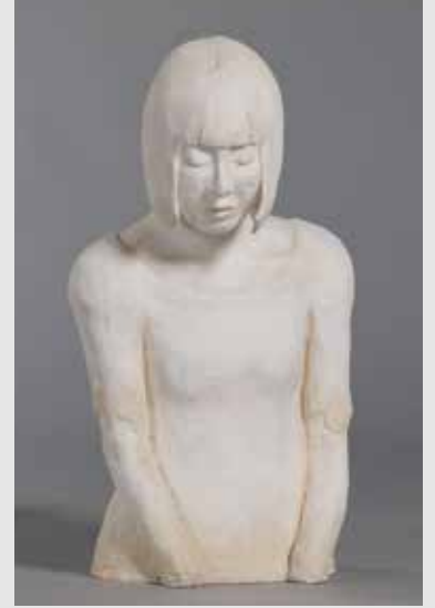
美術コース彫刻専攻