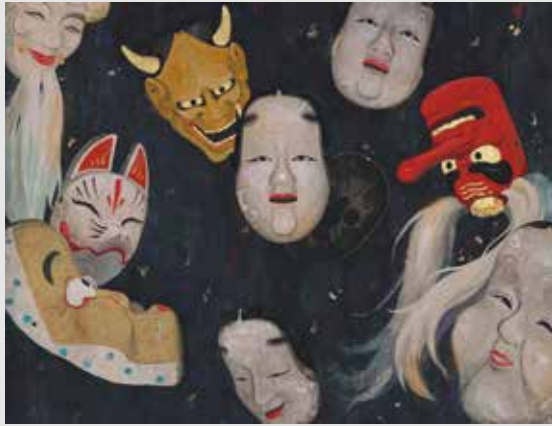
美術コース日本画専攻