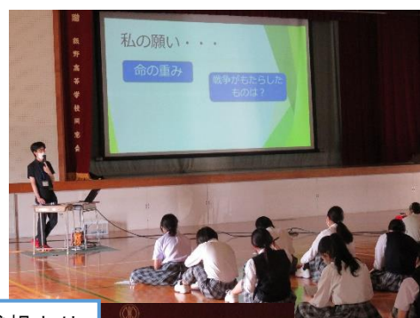
←みなさんの感想より

何回か平和学習をしているけど、あらためて深く知れて良かった。いつも他人事だと思ってしまうけど、自分がそこにいたら考えると本当に恐ろしい話なので、自分事として考えていきたい。／この授業を通して今生きていることが当たり前ではないこと、命の大切さを改めて感じた。／戦争を経験した人のお話を聞いたり、他国の目線でも考えたりしてみたい。／もっと情報を身につけて、修学旅行に行ったときに思い出しながら学びたいと思う。／日本だけの問題ではないから、世界中の人が考えられるようになったら良いと思う。／「平和」や「命」についてしっかり考えたい。／責任をもって学びたい。／関係ないと思いがちだけど、そんなに遠くない話だと思う。今のコロナとかでも同じことが言える。