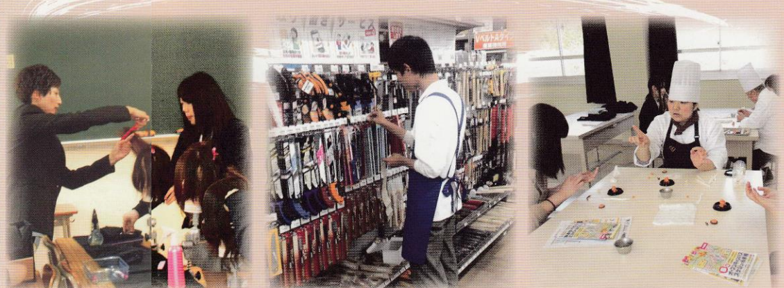
体験型進路ガイダンス