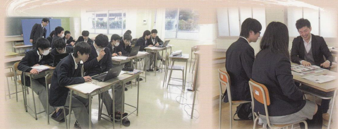
自己理解進路ガイダンス