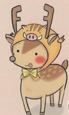
白山高校キャラクター「しかずきんくん」