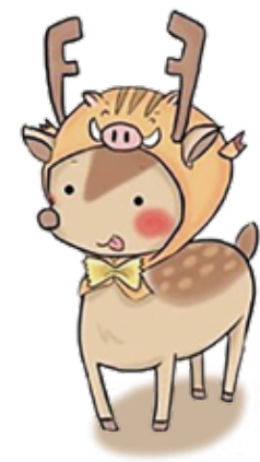
白山高校キャラクター「しかずきんくん」