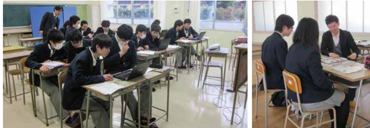
【自己理解進路ガイダンス】