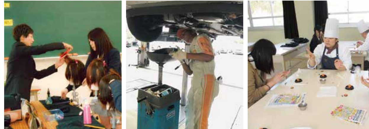
【体験型進路ガイダンス】