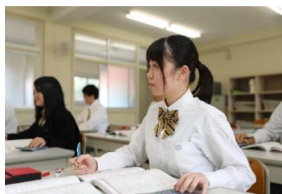
情報コミュニケーション科