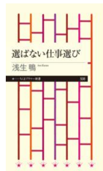
浅生鴨著、筑摩書房、2025

クリーニングのプロが教える正しい洗濯術。一生使える知識となります。クリーニング代も節約できるかも。