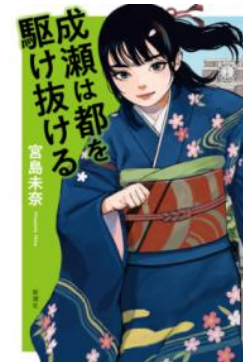
『成瀬は都を駆け抜ける』 宮島未奈著、新潮社、2025

社会人になる前に、スキンケアやメイク、ヘアケアについて、健やかさを保つための基本的な知識をつけてみませんか。ただし、在校中は、学校の校則に従って、できる範囲でのお試しを。