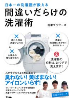
『日本一の洗濯屋が教える間違いだらけの洗濯術』洗濯ブラザーズ著、アスコム、2020

乳製品や卵を使わないチョコレート菓子のレシピ集。からだにやさしいレシピがたくさん載っています。