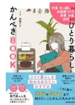
『ひとり暮らしかんぺき BOOK』 加納ナナ マンガ、KADOKAWA、2024