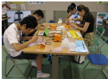
好評の職業科体験コーナー