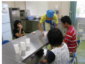
はじめての喫茶コーナー