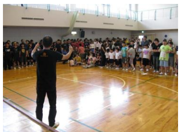
心ひとつに校歌の大合唱