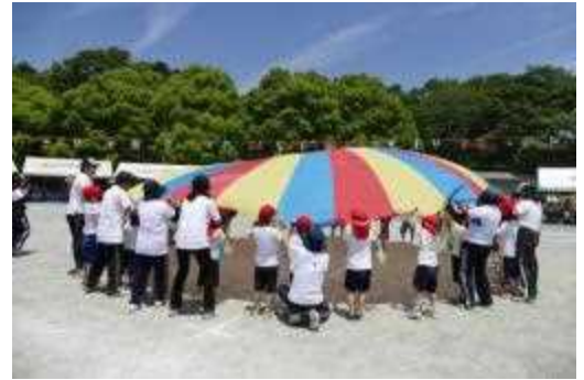
【小学部】 妖怪ウォッチのダンス

5 月 30 日（土）運動会が開催されました。 陽射しあふれる 暑い一日でしたが、児童・生徒のみなさんは、練習の成果をよく発揮してくれました。保護者の皆さま、たくさんの応援を ありがとうございました。