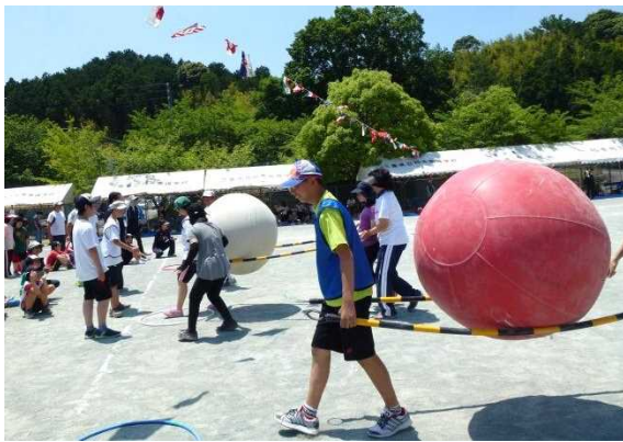
【中学部】 女神よほほえめ！