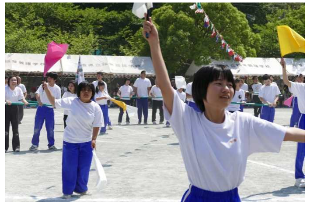
【高等部】 組体操とフラッグダンス