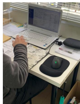
↑ パソコンでの作業