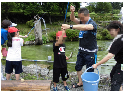
うまくチャッチしました！