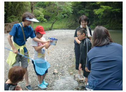
いろいろな生き物見つけたね

夕飯、それぞれが協力して作り上げたカレーとサラダの味は格別で、会話を楽しみながら味わいました。食後の夕べのつどいでは、みんな積極的に手を挙げ、川遊びや釣りのことがとっても楽しかったと話してくれました。