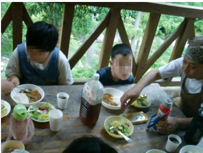
カレーもサラダもおいしいね