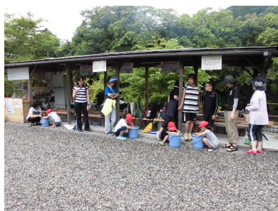
触るのが上手になった！！