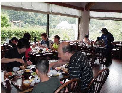
おいしい朝ごはん