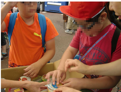
買い物の後、確認してます

天気が心配されましたが、無事、ニジマス釣りと川遊びを行うことができました。魚が釣れると歓声が上がリ、釣れた魚をしっかり触った後、炭火で塩焼きをしたニジマスをおいしくいただきました。川遊びでは、水鉄砲で水を掛け合ったり、かえるやオタマジャクシを捕まえて触ったり、川の流れの中を歩いたり、石を触ったり、水浴びしたりと、友だちと一緒に楽しく過ごすことができました。