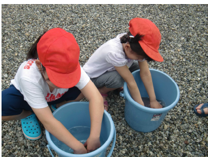
さわる さわる さわる