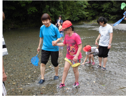
水とっても気持ちよかった♡