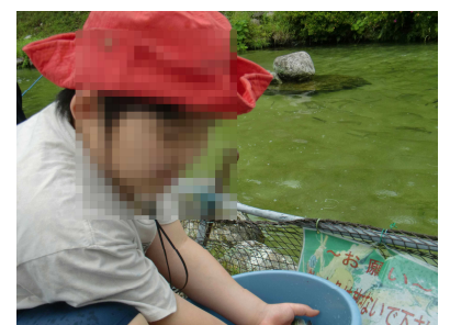
かなり大きいニジマスでした