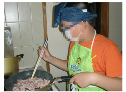
炒めておいしくするよ