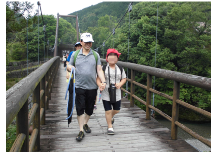
つり橋を渡るとそこは・・・？