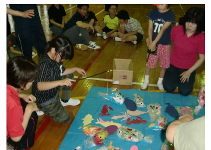
昨日よりも大漁だあ！！