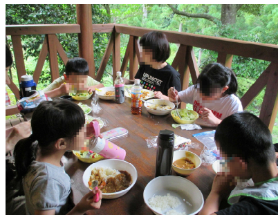
みんなで作った味は格別！