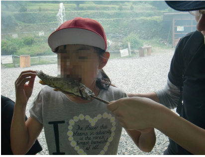
ニジマスおいしい～！！