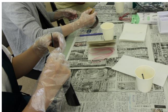
レザーの端の処理をしています