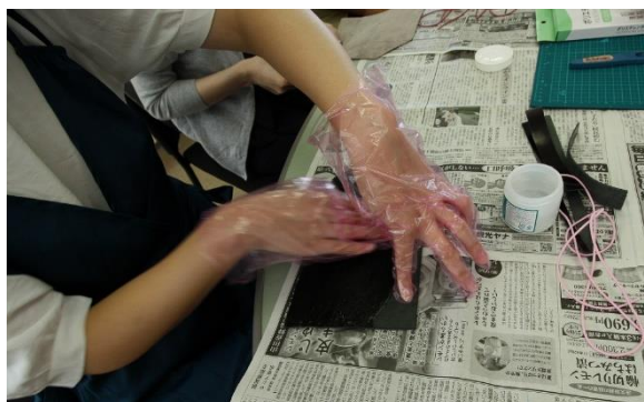
切断したレザーの裏側を整える作業中