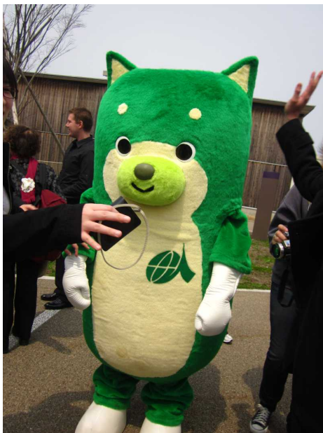
AIU のマスコット ONE (ワン) くん。 世界遺産 (自然遺産) の白神山地。広大なブナの原生林は動植物の宝庫。