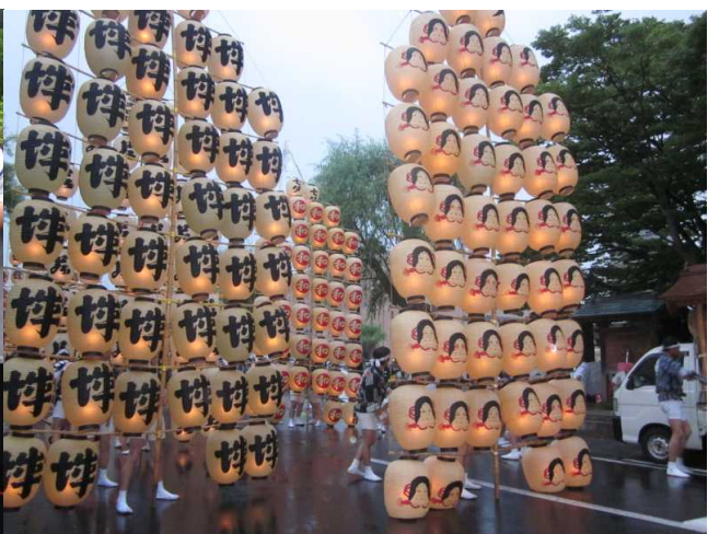
竿燈祭り。東北の祭りはどこも地域色豊かで盛大です。 こうした経験ができるのも大学生ならではです。