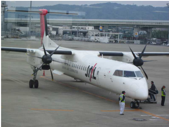
中部空港から約 70 分 大学は空港の近くにあります。