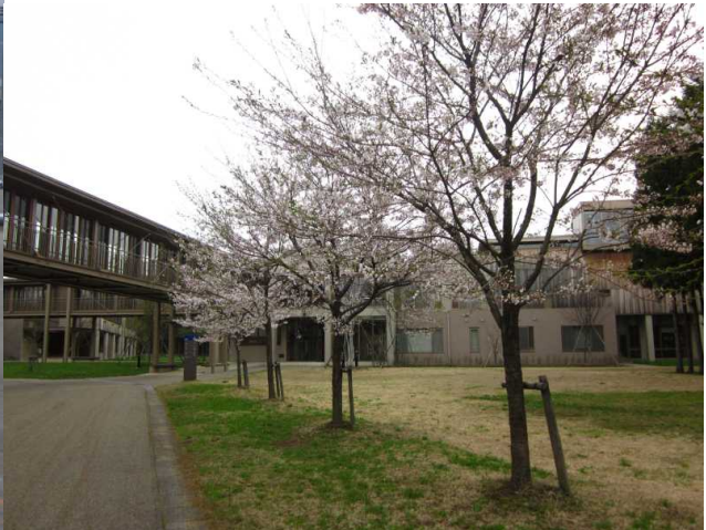
緑豊かなキャンパス。桜は四月下旬が見頃です。