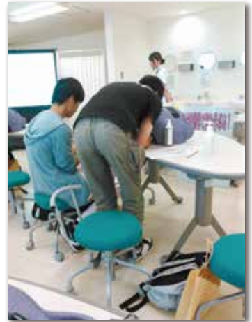
滋賀県立大での実習

夏季休業中に視野を広げるため、県外の大学見学会があり、全員が参加します。平成29年度は1年生は名古屋大学、名古屋市立大学の2大学へ、2年生は和歌山大学、静岡大学、名古屋大学、岐阜大学の4大学へ見学に行きました。