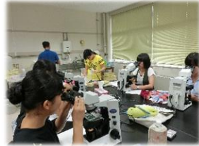
ウニの発生の観察