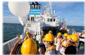
大気観測(ラジオゾンデ)