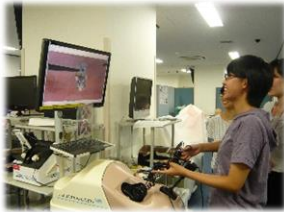
医学部サマーセミナー