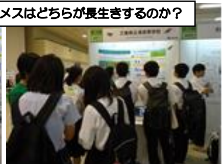
たくさん的高校生が研究内容を聞きにきました。