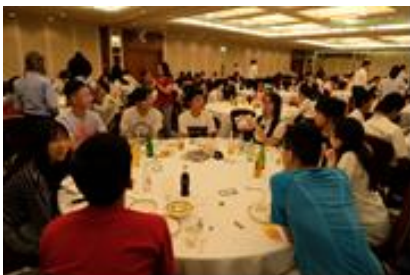
海外の高校生との交流会