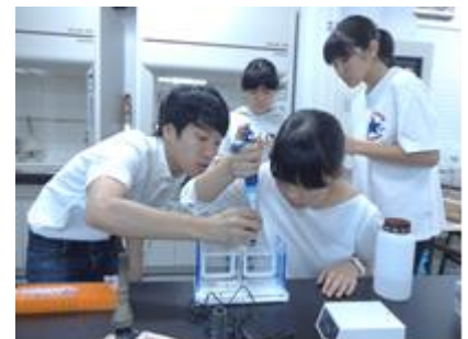
三重大学教育学部理科研修

津高校 SSH のホームページにも、全国発表会や夏季フィールドワーク等の様子を掲載してあります。また、探究活動Ⅰ・Ⅱや SSC などの活動・取組み掲載しありますので、一度アクセスしてみてください。スマートフォン、タブレット等は、右の QR コードよりアクセス出来ます。