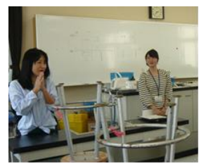
TAによるサポート開始