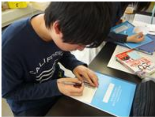
今年度より研究ノートを使用

※ TA(ティーチングアシスタント)は，探究活動の授業に参加し，研究補助(アドバイス・進捗状況の確認)，授業の準備等を行います。