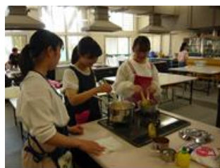
手際よくジャムを作成