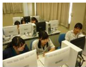
事前の調べ学習が重要