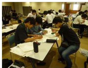
和風料理店てんぷす