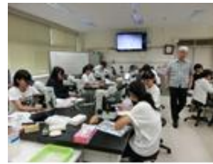
ウコの発生の観察