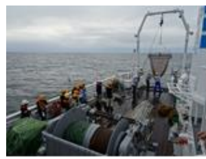
底曳網で生物採集