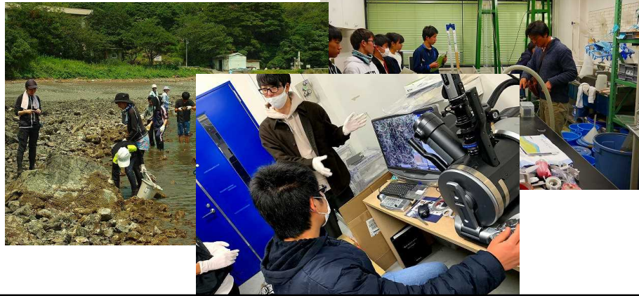
大学等で最先端の研究を体験する