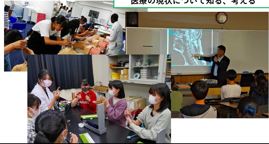
医療の現状について知る、考える