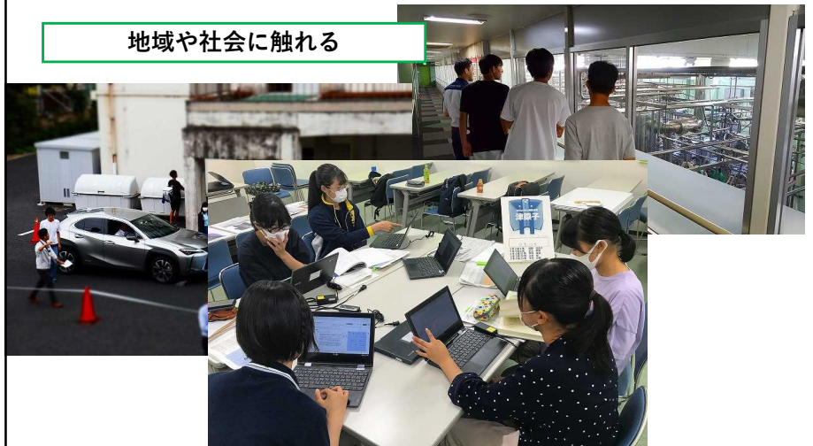
地域や社会に触れる