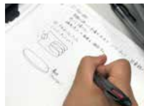
▲探究活動(研究ノート)