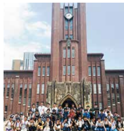
▲東大キャンパスツアー