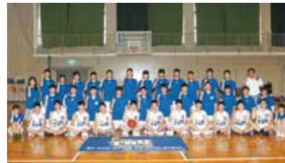
▲バスケットボール部