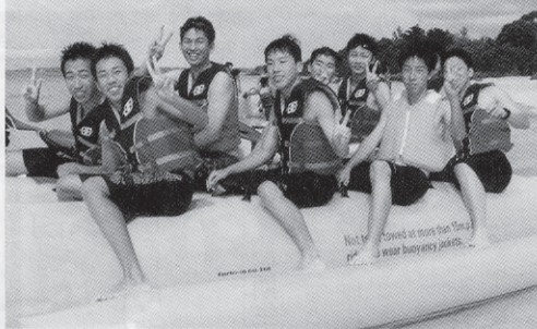
平成15年 修学旅行 沖縄

登城が丘の草の上 ひたむきに若さを生きる 歌声の海へ広がる この丘にわれらはまなぶ 喜びも悩みも共に