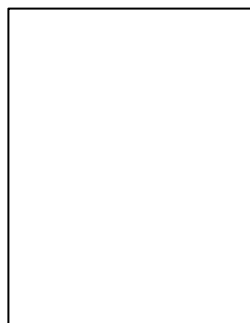
『別冊しんぷる 松阪の本』 松阪のエリア別まち 歩き&グルメガイド。