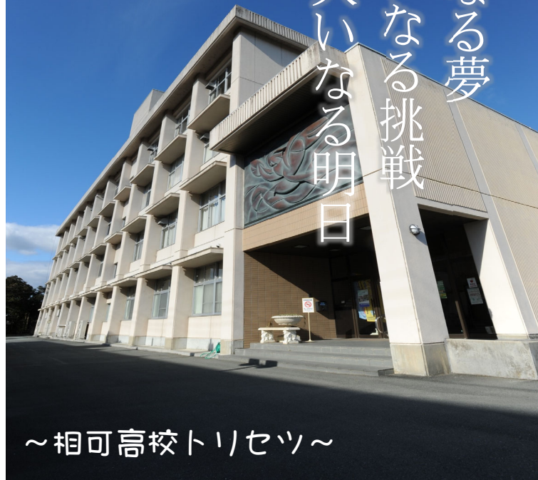
～相可高校トリセツ～