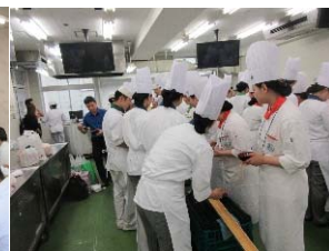
韓国調理科学高校来校