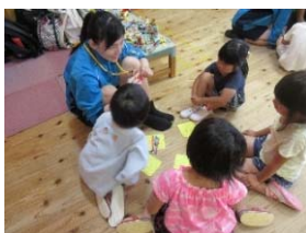
保育実践で進路実現を目指す

6/25(月)就職希望者説明会があります。7月1日から企業の求人票受付が始まり、5日(木)から生徒に公開します。進路部、担任、保護者とよく話し合い、希望進路の実現にむけて取り組んでください。「自分の進路は自分で切り開く！」