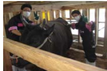
←新実習服 袖のピンクの水玉がポイント

農業の世界を明るく!! 今年から生産経済科の実習服が生徒達が考えた新しいデザインに変わった。上下別々だった服がつなぎに変わり、服の色が黒色に統一されている。貴重品や日焼け止めクリームが入るようにポケットが大きめになっていたり、内側の生地が水玉模様になっていたり、胸とお尻に『wellbeing』というロゴが入っていたりと趣向を凝らしたデザインになっている。