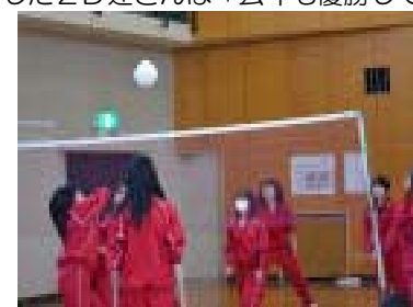
→女子家庭バレーボール

昨年度、3月15日(金)18日(月)の2日間クラスマッチが行われた。1日目は快晴。2日目は天気が心配されたが、どんよりした天気も吹き飛ばす白熱したゲームで、最後まで無事に終えることができた。