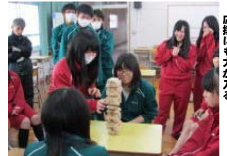
←ジェンガ緊張の瞬間 応援にも力が入る