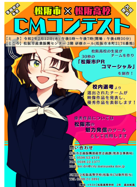
↑ 生徒が作成したポスター