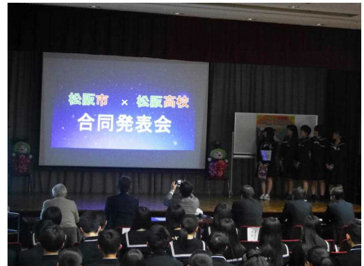
プレゼンのスタート