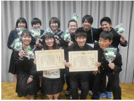
最優秀賞の2チーム