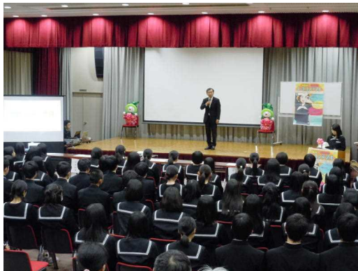
開会式(学校長挨拶)