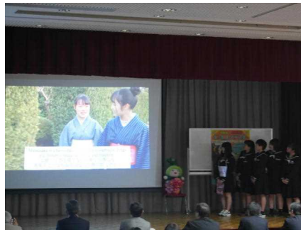
英語のナレーション(字幕付き)