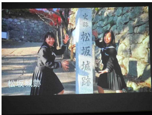
松阪市のFreeWi-Fiからの跳躍