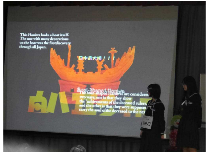
松阪の宝塚古墳(船形埴輪)