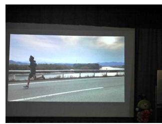
マラソンコースを走る