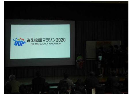
テーマは「みえ松阪マラソン2020」