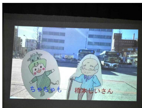
ちやちやもと橋本じいさん(鈴の音バス)