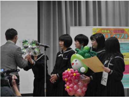
2年生の表彰（2年1組はらぺこ）