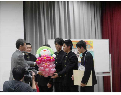
1年生の表彰（1年8組翔琉×駆ける）