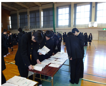
展示された論文を熱心に読んでいます