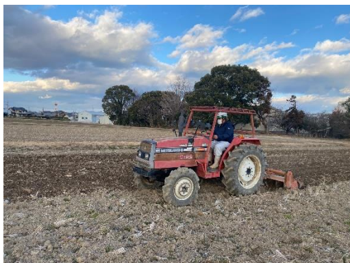
トラクターに乗って水田を耕します