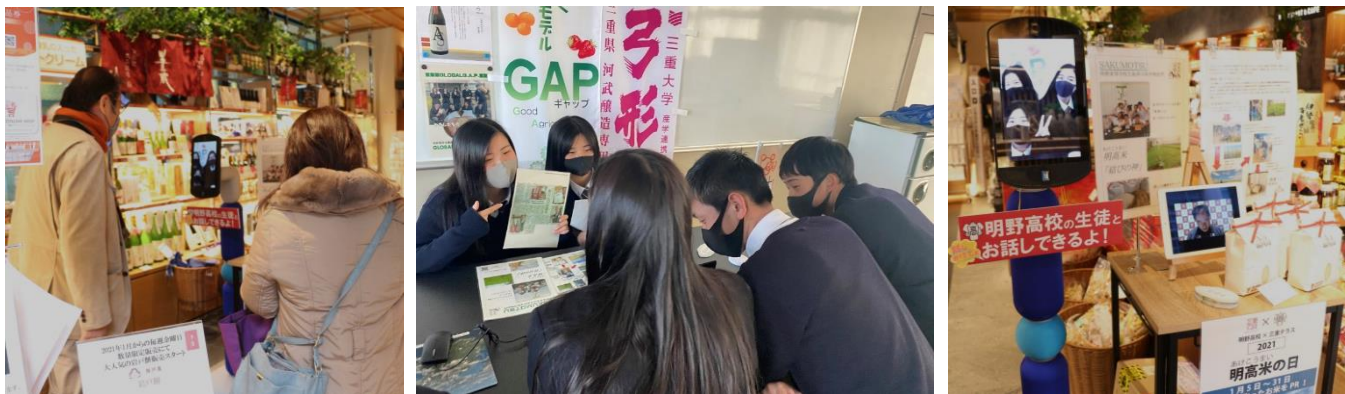
◎東京日本橋にある三重県のアンテナショップ「三重テラス」でのアバターロボットを活用した取組みの様子

また、今年度は海外輸出にも取り組んでおり、今期の冬にはICTを活用したアメリカで明高米の宣伝を予定しています。