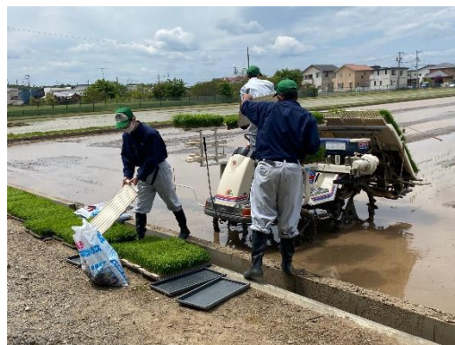
田植え機での植付け作業の様子