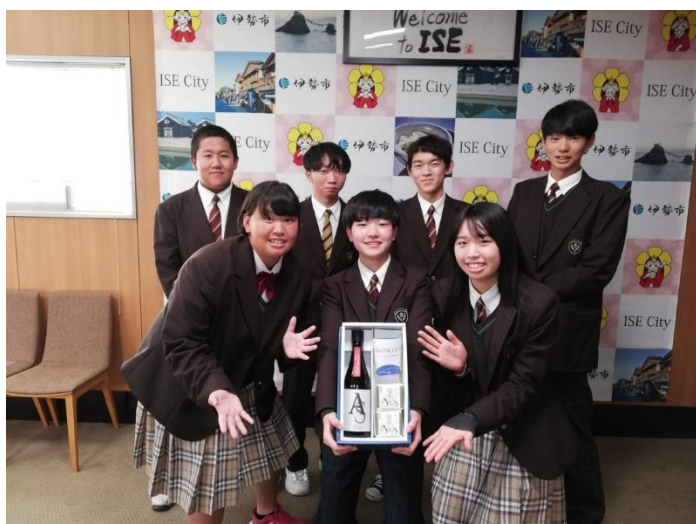
◎明高米と明野さくもつが伊勢市のふるさと納税返礼品に伊勢市長へ表敬訪問しました。