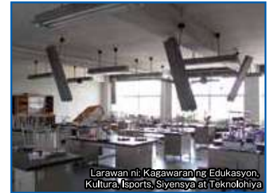
Larawan ni: Kagawaran ng Edukasyon, Kultura, Isports, Siyensya at Teknolohiya