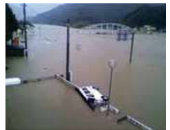
Great Flood in the Kii Peninsula

Mga bagyo nga moabot sa Mie kada tuig. Mangutana sa mga panghitabo sa miaging katalagmansa imong lugar nga gidala sa bagyo.