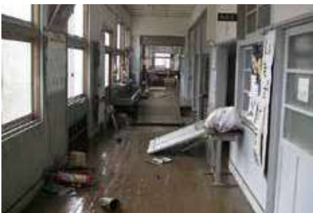
Mga agi-anan nga napuno sa tubig