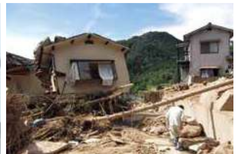
Paglanslide o pag-inas