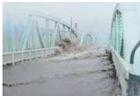
Baha tungod sa suba