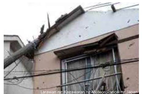
Tirahan na nasira dahil sa bumagsak na poste ng kuryente