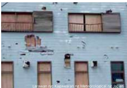
Ang mga nasirang pader ay dulot ng mga lumipad na bagay