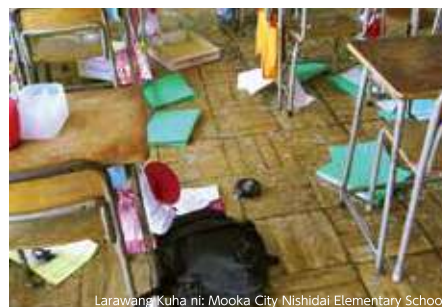
Silid-alaran na may mga basag na salamin