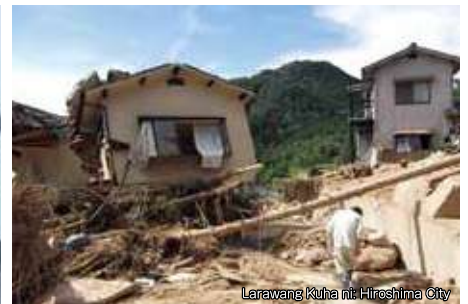
Pagguho ng Lupa