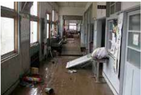
Mga pasilyong puno ng tubig