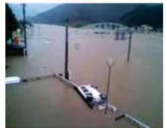
Great Flood in the Kii Peninsula