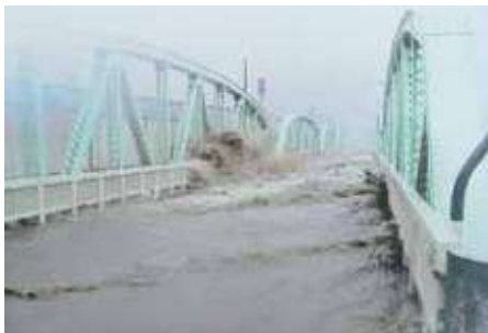
Pagbaha dahil sa ilog