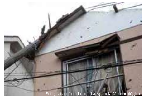
Aula con los cristales rotos