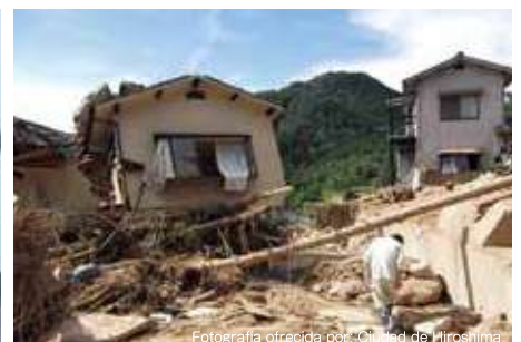
Flujo de lodos