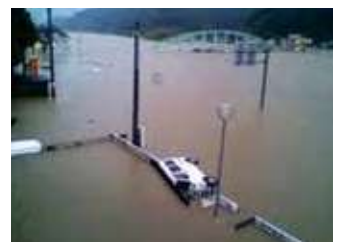
Inundaciones de la península de Kii.