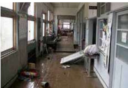
Pasillo lleno de barro