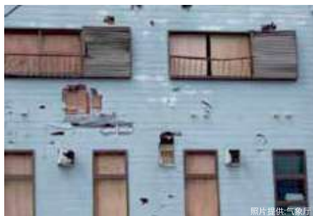
被飞来物品砸坏的墙壁