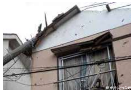
被倒塌的电线杆砸坏的房子