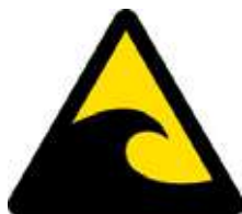
Mga Pasidaan sa Tsunami