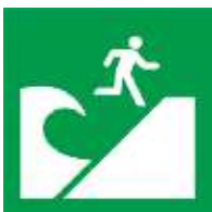
Lugar nga Balhinan sa Takana nga naay Tsunami