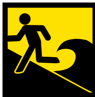
Mga Lugar Nga Kuyaw Sa Tsunami