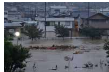
Great Flood in the Kii Peninsula