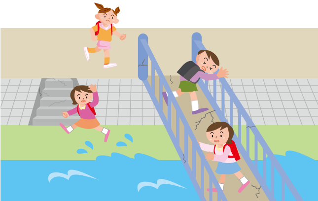
Duol sa Suba ug Tulay