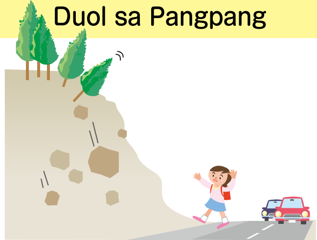
Duol sa Pangpang