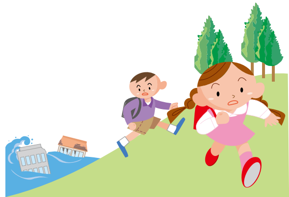
Duol sa Kadagatan