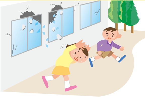
Tupad sa school building