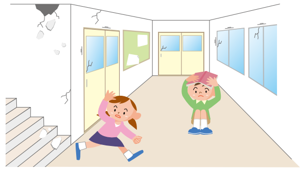
Agi-anan ug hagdanan