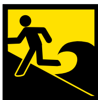
Lugar na May Banta ng Tsunami

Ang sukat ng tsunami ay magkaiba depende sa lakas ng lindol at iba pa salik. Huwag mag-isip na kayo ay ligtas dahil sa ang inyong bahay ligtas sa tsunami sa nakaraan!