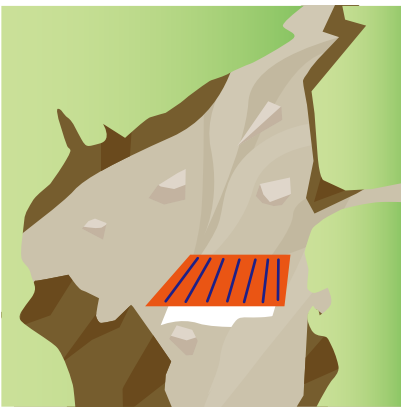
Pagragasa ng Buhangin at Bato

Mga bato at mga tipak ay raragasa patungo sa ibabang bahagi dahil lakas ng bagyo.