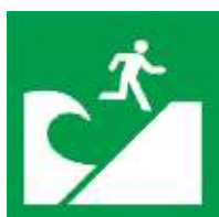
Lugar ng Evacuation sa Panahon ng Tsunami.