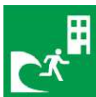
Gusali Para sa Paglikas sa Panahon ng Tsunami