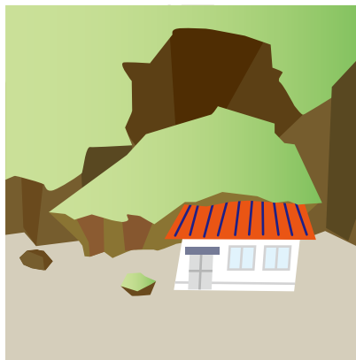
Uka ng Lupa

Ang tubig sa ilalim ay dahan dahang aangat sa lupa sa pamamagitan ng madulas na putik gaya ng burak.