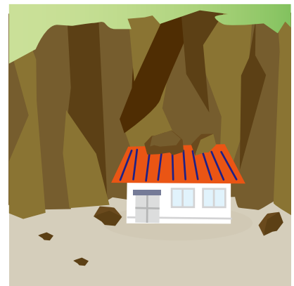
Pagguho ng Lupa

Ang matatarik na mga bangin ay nasisira dahil sa malakas na bagyo.