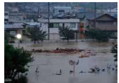
Great Flood in the Kii Peninsula