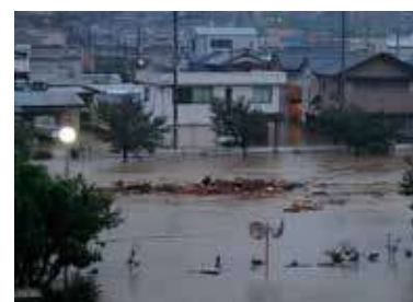
Inundaciones de la península de Kii.