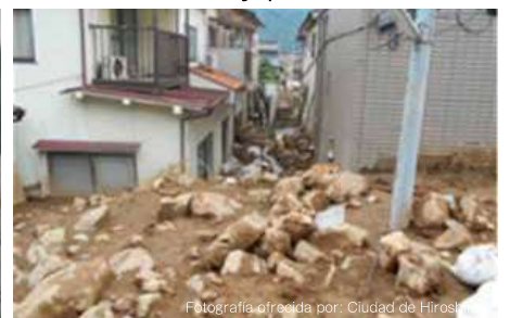
Desplazamiento de tierras y piedras